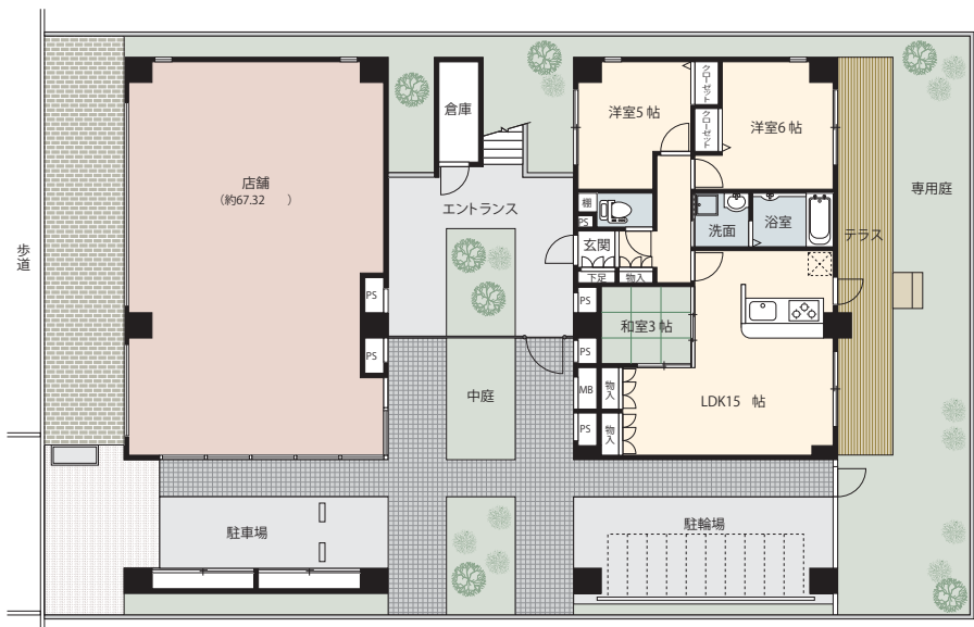
1階(店舗・101号室)平面図

けやき通り沿いの閑静な街並と充実した生活施設がうれしい住環境 中庭に面し、両面バルコニーなど採光と通風に考慮した設計デザイン 住む人のプライバシーに配慮した工夫をこらした3階建マンション。