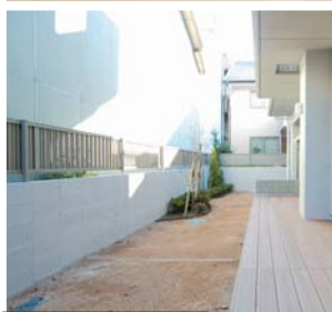
101号室専用庭&テラス